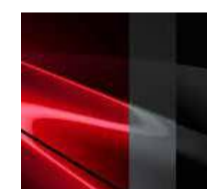
47E Soul Red Crystal

Trīs toņu Premium Metallic stila krāsojums, 1200 €