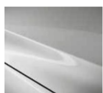
47A Ceramic metallic

Trīs toņu Metallic stila krāsojums, 900 €