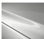
A4D Arctic White