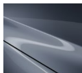
47C Polymetal Gray (tikai hečbeka modeļiem)