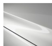
25D Snowflake White Pearl