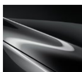
46G Machine Gray