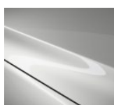
A4D Arctic White