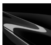
41W Jet Black