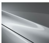
45P Sonic Silver