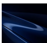
42M Deep Chrystal Blue