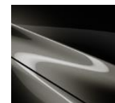
42S Titanium Flash