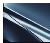
45B Eternal Blue Metallic