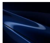
42M Deep Crystal Blue