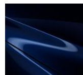
42M Deep Chrystal Blue