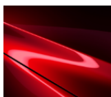
46V Soul Red Crystal

Premium Metallic stila krāsu varianti, 600 €