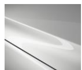
25D Snowflake White Pearl

Metallic stila krāsu varianti, cena 500 €