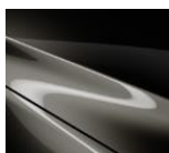
42S Titanium Flash