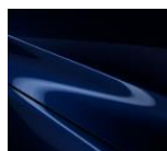
42M Deep Crystal Blue