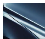
45B Eternal Blue Metallic