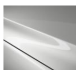
A4D Arctic White