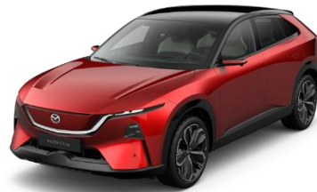
46V Soul Red Crystal