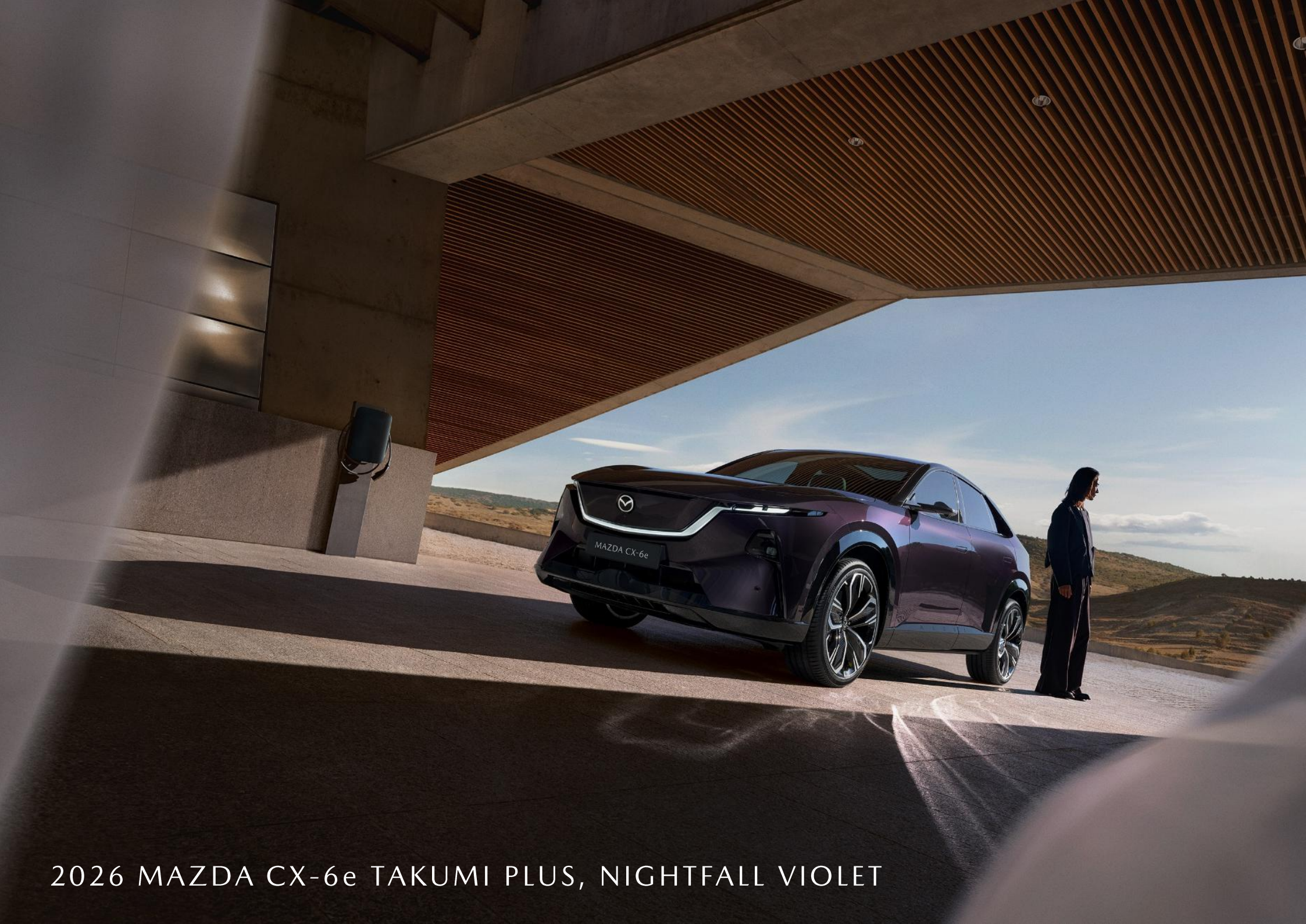
2026 MAZDA CX-6e TAKUMI PLUS, NIGHTFALL VIOLET