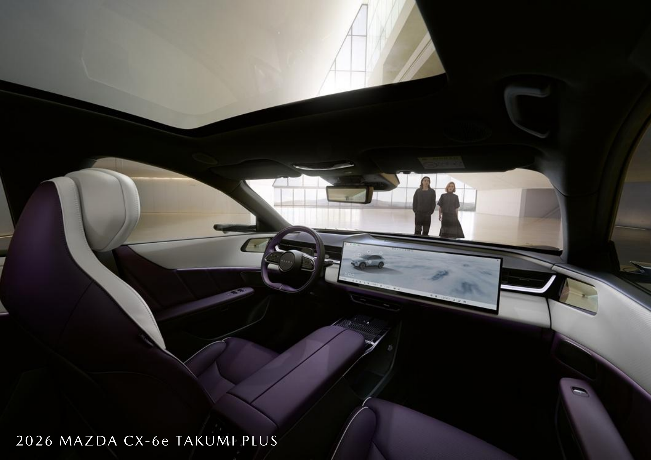
2026 MAZDA CX-6e TAKUMI PLUS