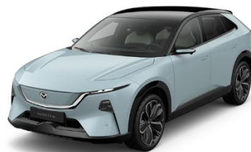
52L Air Stream Blue