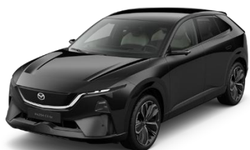
41W Jet Black