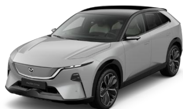
52C Aero Grey