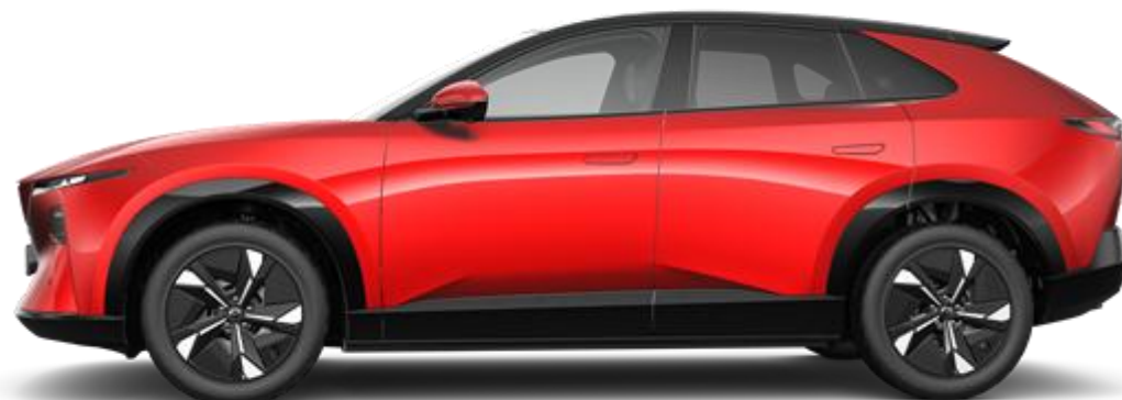
19" vieglmetāla diski (235/55 R19)