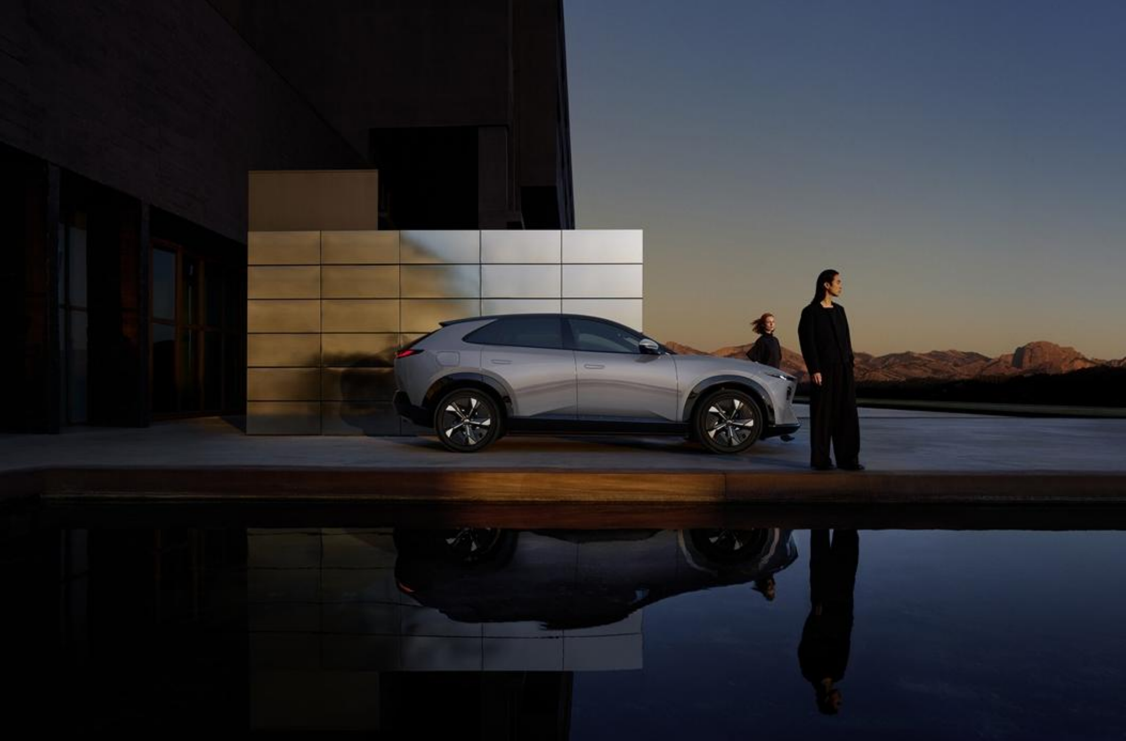
2026 MAZDA CX-6e TAKUMI, AERO GREY