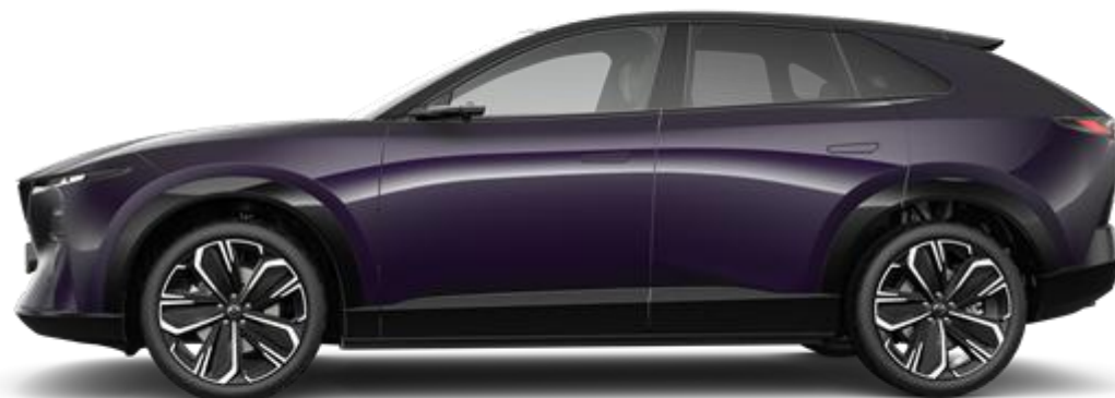
21" vieglmetāla diski (255/40 R21)