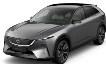
46G Machine Grey