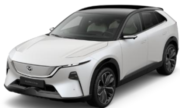
34K Crystal White Pearl