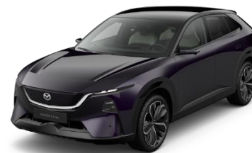
53N Nightfall Violet