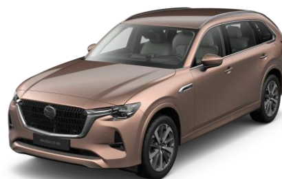
52H Melting Copper