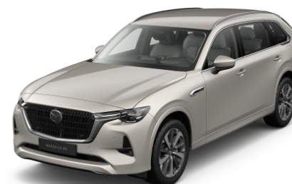
47S Platinum Quartz