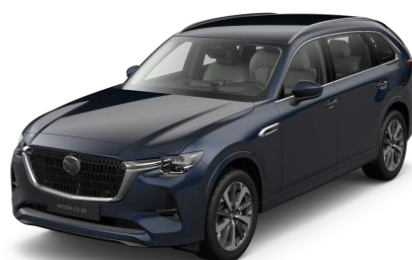
42M Deep Crystal Blue