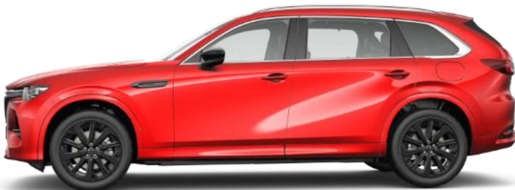
20 collu Black stila vieglmetāla diski (235/50R20)