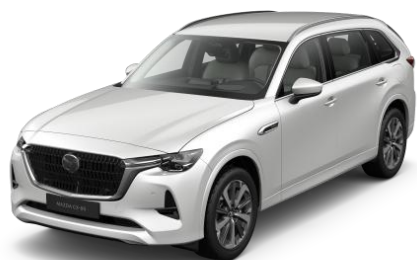
51K Rhodium White