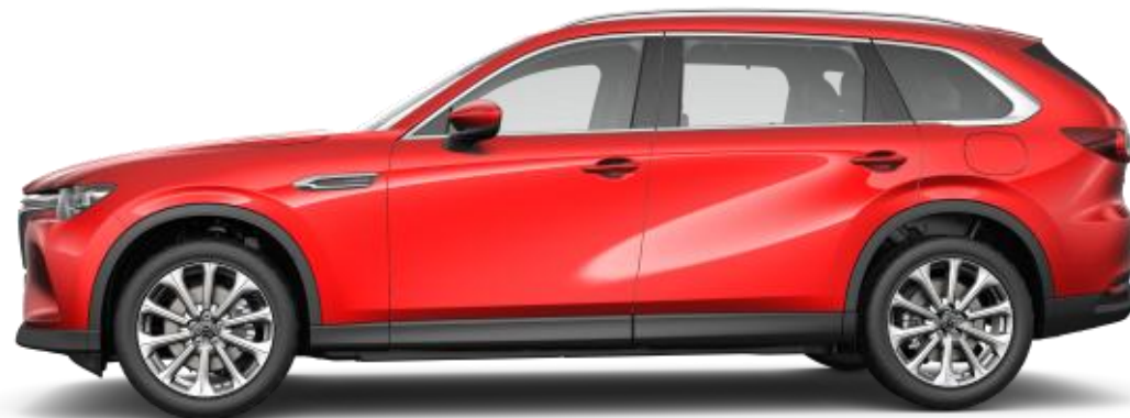
20 collu Bright stila vieglmetāla diski (235/50R20)