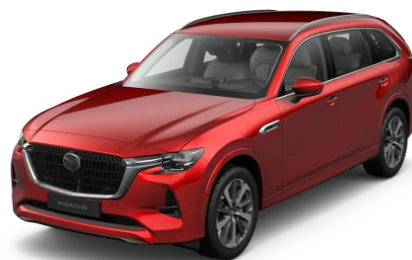
46V Soul Red Crystal