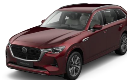
51F Artisan Red