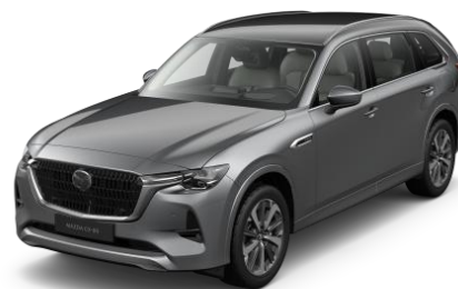
46G Machine Gray