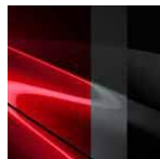
46V Soul Red Crystal