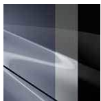
47L Polymetal Grey