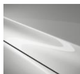
A4D Arctic White