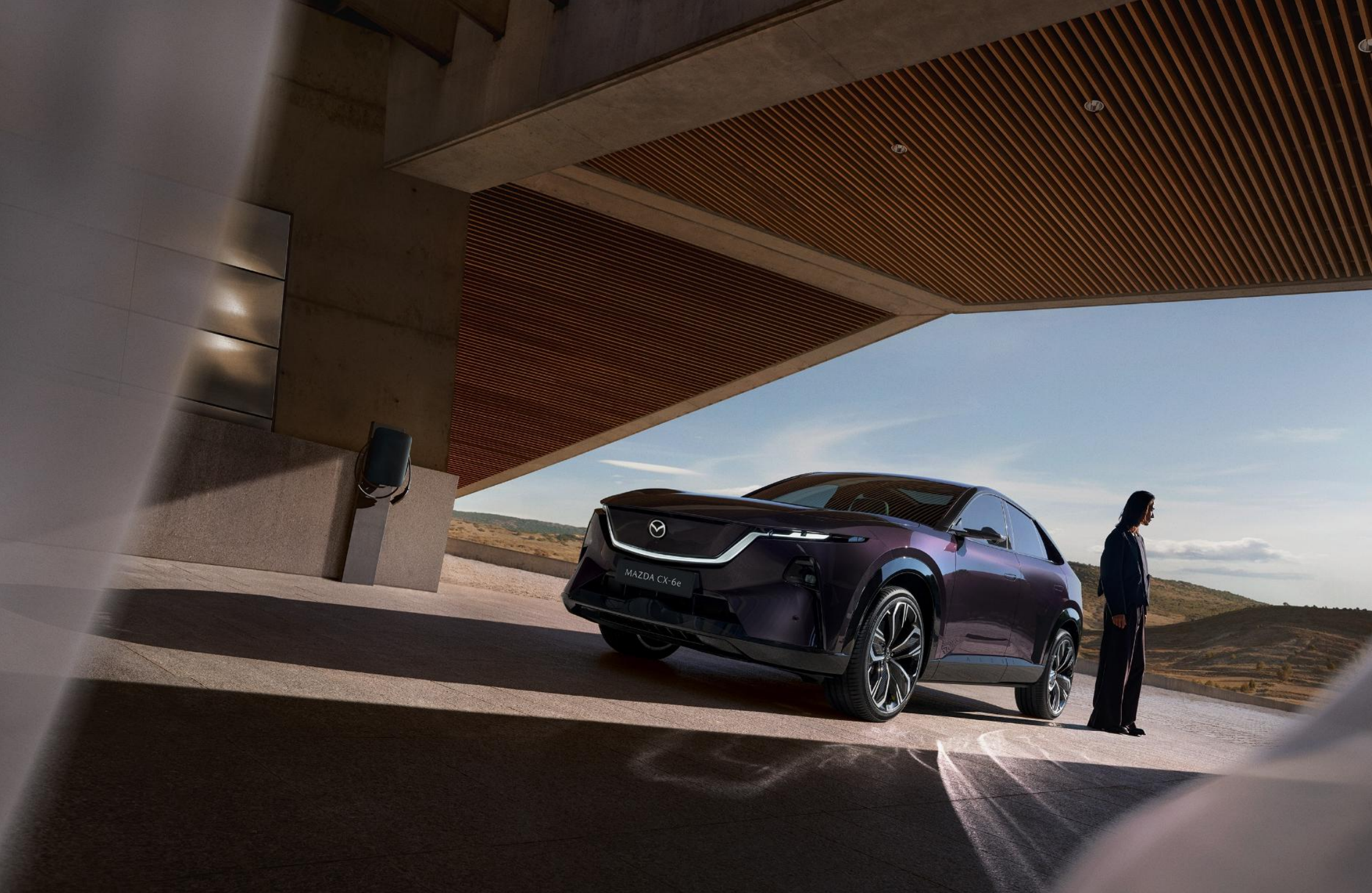
2026 MAZDA CX-6e TAKUMI PLUS, NIGHTFALL VIOLET